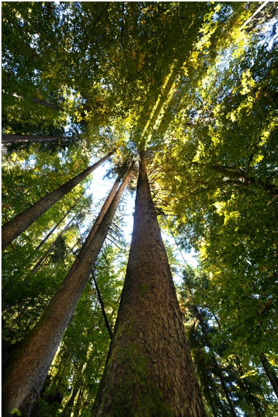
Épicéas- forêt Cohennoz

Orientée Nord-est /Sud-ouest, ces forêts vivantes s'appuient contre le Massif du Beaufortain et font face au Massif des Aravis. Elles sont situées sur un versant dont la pente moyenne est de 60%, et s'étendent depuis la rivière Arly à environ 600 m d'altitude jusqu'au Mont Bisanne. Véritable continuum forestier, elles sont majoritairement composées de bois d'épicéa (70 %) mais aussi de sapin (20%), avec un sous-bois le plus souvent couvert de fougères et d'éricacées, et une proportion de feuillus (hêtre, sorbier des oiseleurs, châtaignier, noisetier, érable sycomore, alisier blanc, bouleau...) qui augmente en dessous de 700m d'altitude.