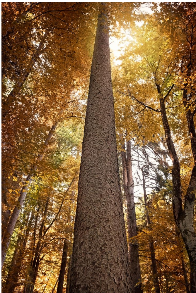
Epicéas - Automne – Cohennoz

Chaque forêt est unique : elle est le fruit d'un travail réalisé sur plusieurs générations. Ces forêts privées de Cohennoz, riches en bois de très belle qualité, peuvent devenir l'objet de convoitises peu scrupuleuses.